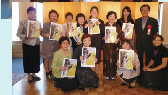
▲学長より写真の特別プレゼント当選者