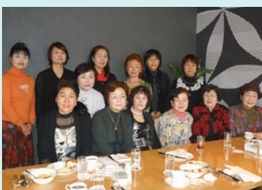
▲金山ホテルグランコート名古屋にて

時代を鑑みて、同窓会活動等にメールやネットを気軽にアクセスできる繋がり的手段として利用するのも必要だと思う。