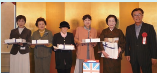
▲ロイヤルコペンハーゲンのお皿当選者

卒業して以来3回程同窓会に参加させていただきました。今回の抽選会でロイヤルコペンハーゲンのお皿が当選するとは夢にも思いませんでした。好運にもステキなプレゼントをいただきとても嬉しく思っております。総会後には、アミーコ KKKによるコンサートもあり、楽しいひとときを過ごすことができ、ありがとうございました。