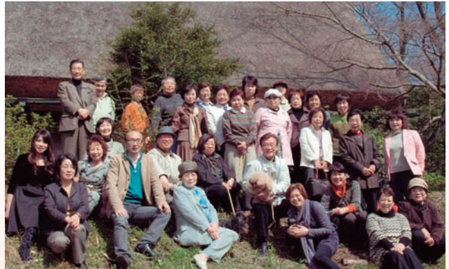
▲みなみやままでの花見の会

同窓会は「屋根葺き替えのお祝い金」を同窓会長から学長に贈呈しました。事の外お喜びになり「古民家に必要なものを買いたい」とのお言葉でした。参加者一同うれしい気持ちになりました。今後も自然のぬくもりに触れたいものです。皆様もお出かけください。