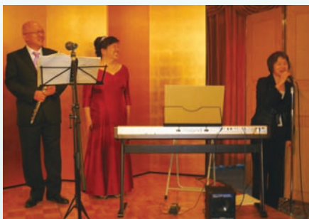
▲アミーコKKKによる演奏