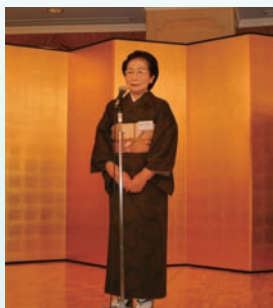
▲同窓会会長あいさつ