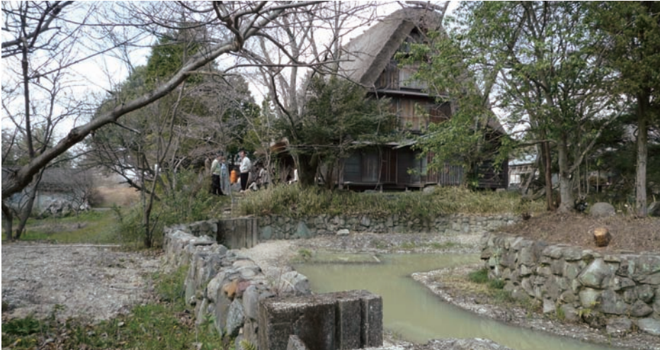
▲環境教育の一環として、茅葺屋根が新しく葺き替えられ、ビオトープが整備された母校みなみやま学舎

発行日 / 2010年7月24日 発行所 / 名古屋文化短期大学同窓会 〒461-8610 名古屋市中区葵一丁目17-8 TEL (052) 931-7112 FAX (052) 931-7117 URL http://nfcc-nagoya.com 編集 / 会報委員 石原和子・小笠原絢子・河上ちさえ